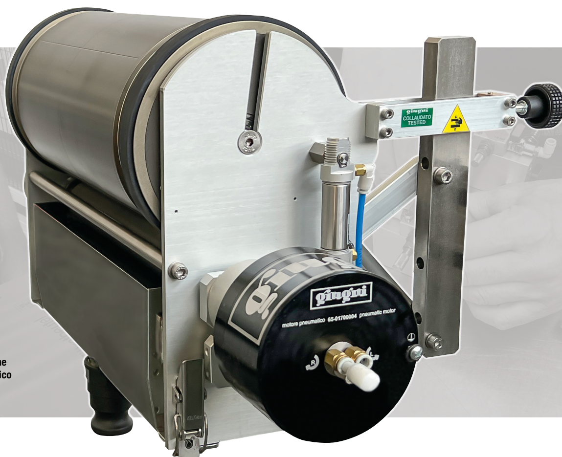
Miniflex® 390 versione con motore pneumatico Miniflex® 390 with pneumatic motor