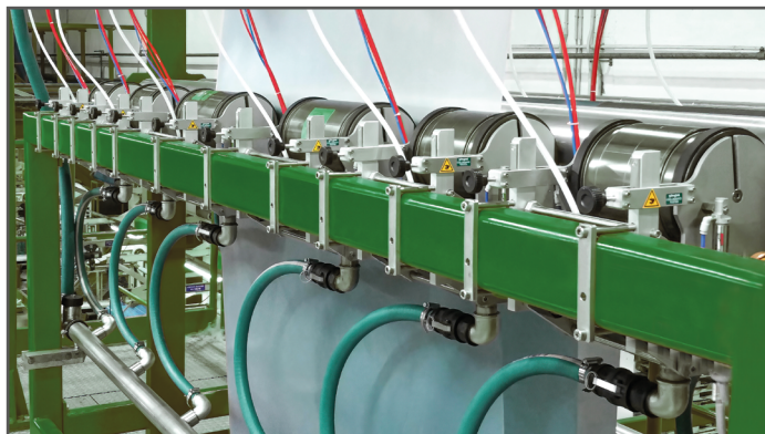
Montaggio su staffa per stampare con più macchine sulla stessa linea Installation on supporting bracket to print with several machines on the same line

► PARTICOLARMENTE ADATTA PER LA STAMPA DI MARCHI AZIENDALI, SIMBOLI DI RICICLAGGIO, IMMAGINI E LOGHI DI MEDIE-PICCOLE DIMENSIONI