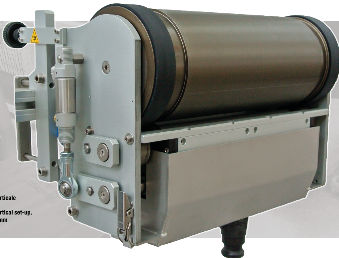
Miniflex®385-300 verticale sviluppo 500 mm Miniflex®385-300 vertical set-up, printing repeat 500 mm